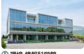
11 環境・情報科学館 世界への環境先進大学を目指すために、環境に関する取組等を分かりやすく展示し、環境を学べるコーナー等を設けています。