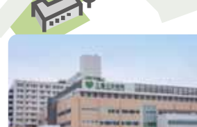
3 生物資源学部校舎