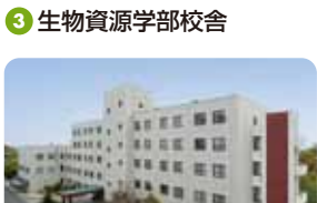
3 生物資源学部校舎